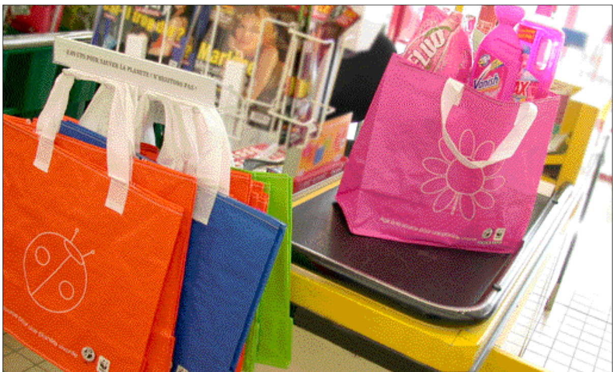
CHAMPION. Création et lancement de la série de sacs recyclables.