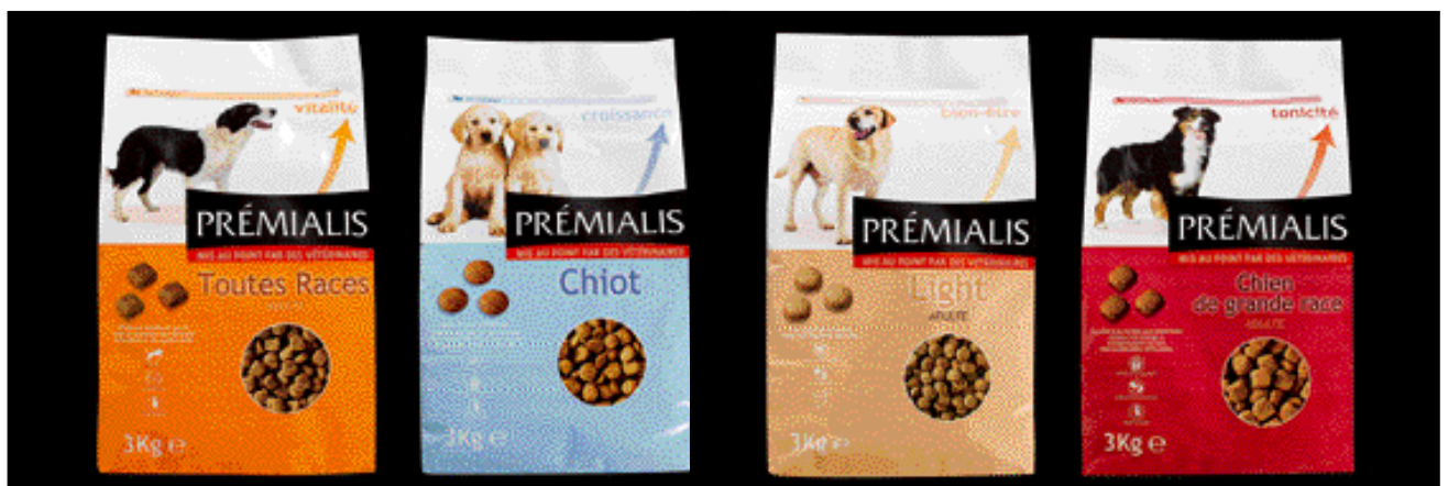
BOTANIC. Création de gamme.