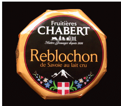
FROMAGERIES CHABERT. Création de gamme L.S.